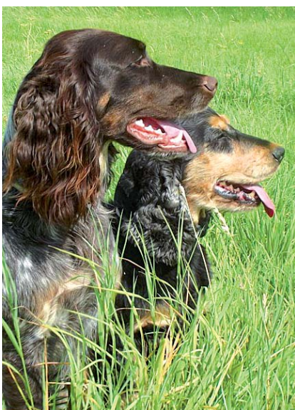
Německý křepelák a anglický kokršpaněl

Slídiči jsou podle mezinárodní kynologické organizace FCI zařazeni do VIII. skupiny - slídiči, retrívři a vodní psi. Intenzita využití jednotlivých plemen pro lov je v různých státech světa velmi odlišná. Největší využití nachází každé z plemen zejména v zemi svého původu, za předpokladu velkého nadšení chovatelů pro lov a zachování tradice lovu.