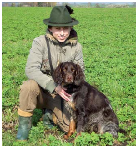
Vhodný myslivecký oděv vůdce

Vůdce psa by měl být vhodně myslivecky ustrojen – ale co si pod tím představíte? Vhodné barvy jsou zelená (ale ne všechny odstíny), hnědá, kha-