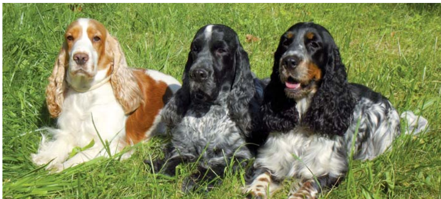
Anglický kokršpaněl je dnes oblíbeným společenským psem, nezapře však geny loveckého psa a pro mysliveckou praxi je nepostradatelný.

Většina nezůstává jen u lovecké kynologie. Dříve či později absolvuje zkoušku z myslivosti a stane