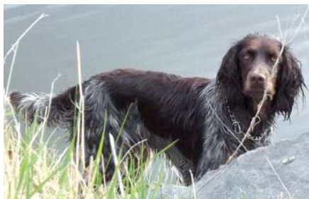
Německý křepelák – jediný z kontinentálních slídičů.

Abychom se mohli těšit ze společné práce s naším čtyřnohým přítelem, je nezbytné brát myslivost jako celek, chápat ji a respektovat její pravidla.