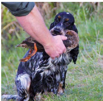
Kokršpaněl s kachnou...

Práce slídiče, tak jak je vyžadována v naší zemi, se vyznačuje systematickým prohledáváním polí, luk, remízků, houštin, zkrátka všech krytin, kde by se mohla vyskytovat zvěř. Vůdce pohyb psa usměrňuje většinou píšťalkou a ukazováním rukou do směru, kterým má pes hledat. Slídění by mělo probíhat na vzdálenost brokového výstřelu, tedy přibližně 30 metrů od vůdce. Pokud pes narazí na pach zvěře (ať už se jedná o zvěř samotnou nebo její čerstvou stopu), měl by ji vůdci tzv. „hlásit“ štěkotem. Zvěř by měl po střelení dohledat a ochotně přinést vůdci. Takto by to v ideálním případě mělo vypadat. Samozřejmě každý lovec si práci svého psa upravuje pro účely konkrétního lovu a rovněž každý pes jako jedinec pracuje trochu jinak. Především zmiňovaná hlasitost spoustě psů chybí, jedná se o vrozenou vloh, kterou stejně jako nos a jiné vlohy v drtivé většině případů nelze naučit. Pokud tyto vlohy pes má, lze je správným vedením rozvinout, stejně jako např. dítě s nadáním pro malování