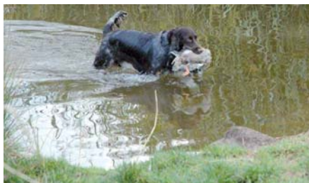
Německý křepelák aportuje kachnu z vody.

Základem loveckého výcviku je především poslušnost, poslušnost a zase poslušnost... Lovecký pes musí být především ovladatelný, proto se základy loveckého výcviku v mnohém podobají sportovní kynologii. Pokud si se základy poslušnosti u svého pejska nevíte rady, určitě nic nezkažte, když s ním absolvujete pár lekcí pro začátečníky na klasickém „cvičáku“. Mluvme v této souvislosti spíše o výchově. Výcvik apor-tu se v lovecké a sportovní kynologii trochu liší, proto si tento cvik raději necháme „na doma“ a dále skutečný výcvik směřujeme loveckým směrem. Pro začátky loveckého výcviku tedy nemusíme se psem do honitby, tyto cviky zvlád-